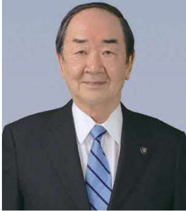
苫小牧市長 岩倉 博文

苫小牧市は人口16万8千人を超える道内4番目の都市です。北海道の海の玄関「苫小牧港」と空の玄関「新千歳空港」のダブルポートを有し、交通アクセスに非常に恵まれております。そのため北海道の産業・物流において大きな役割を担っており、貨物取扱量は全国第4位を誇ります。その一方で、市内東部には勇払原野やウトナイ湖、西部には樽前山、南側には太平洋があり、自然環境にも恵まれています。特産品は「ホッキ貝」で、22年連続水揚げ量日本一を誇っています。